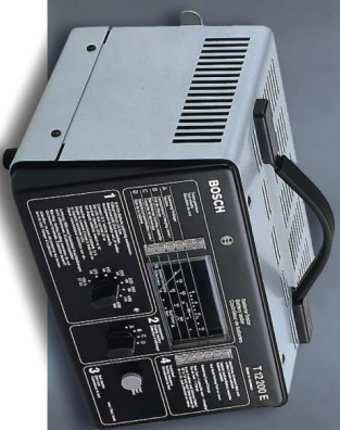
T 12 200 E

Przeznaczony do wszystkich akumulatorów 12 V o pojemności od 27 do 180 Ah, stosowanych w samochodach osobowych. Szczególnie nadaje się do testowania akumulatorów bezobsługowych. Posiada skróconą instrukcję obsługi na płycie czołowej oraz duży wskaźnik analogowy do prostej obsługi.