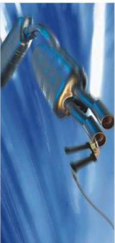
Badanie spalin BEA