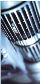
Urządzenia do obsługi klimatyzacji ACS