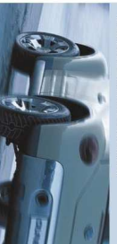
Badanie podwozia FVA