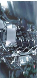
Badanie systemów w polimierze FSA