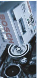
Badanie akumulatora BAT