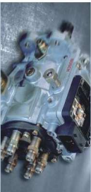
Badanie podciśnięć EPS